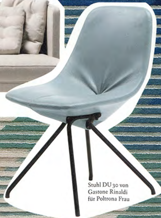
Stuhl DU 30 von Gastone Rinaldi für Poltrona Frau