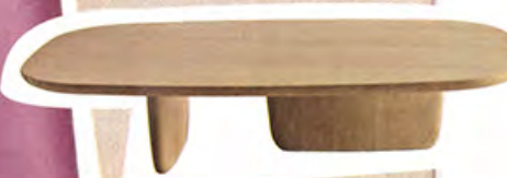
Beistelltisch Tobi Ishi Small von Edward Barber und Jay Osgerby für B&B Italia