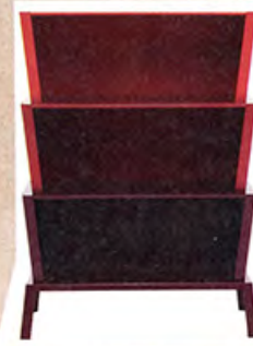
Regalsystem 96 Grad von Karoline Fesser