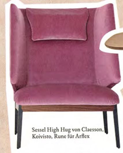
Sessel High Hug von Claesson, Koivisto, Rune für Arflex