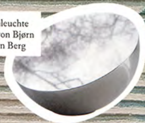
Bodenleuchte Aura von Bjørn van den Berg