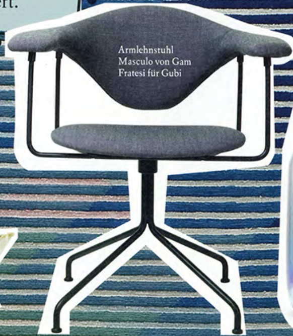
Armlehnstuhl Masculo von Gam Fratesi für Gubi