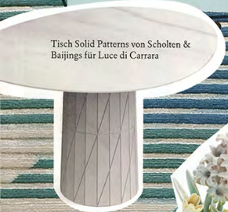
Tisch Solid Patterns von Scholten & Baijings für Luce di Carrara