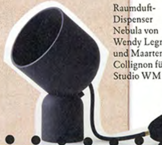
Raumduft-Dispenser Nebula von Wendy Legro und Maarten Collignon für Studio WM