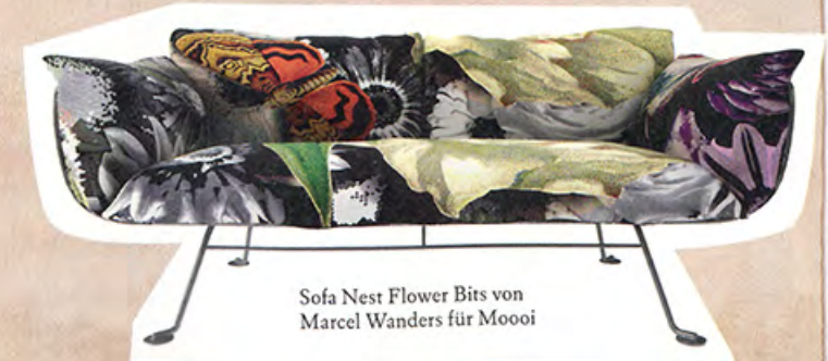
Sofa Nest Flower Bits von Marcel Wanders für Moooi