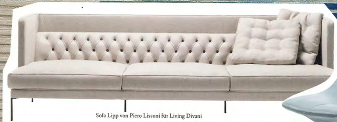
Sofa Lipp von Piero Lissoni für Living Divani