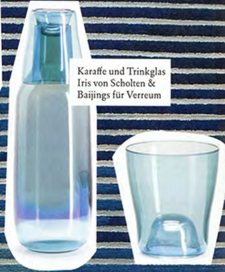
Karaffe und Trinkglas Iris von Scholten & Baijings für Verreum