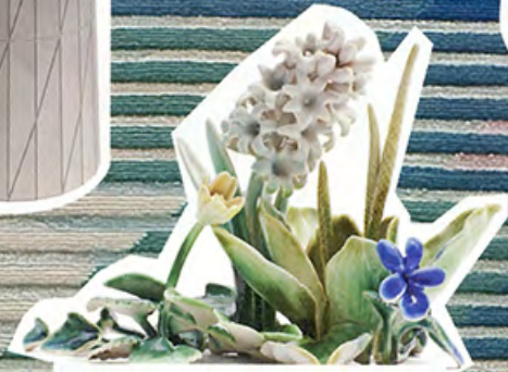
Keramikblumen Flower Arrangement von Marianne Nielsen für Mindcraft